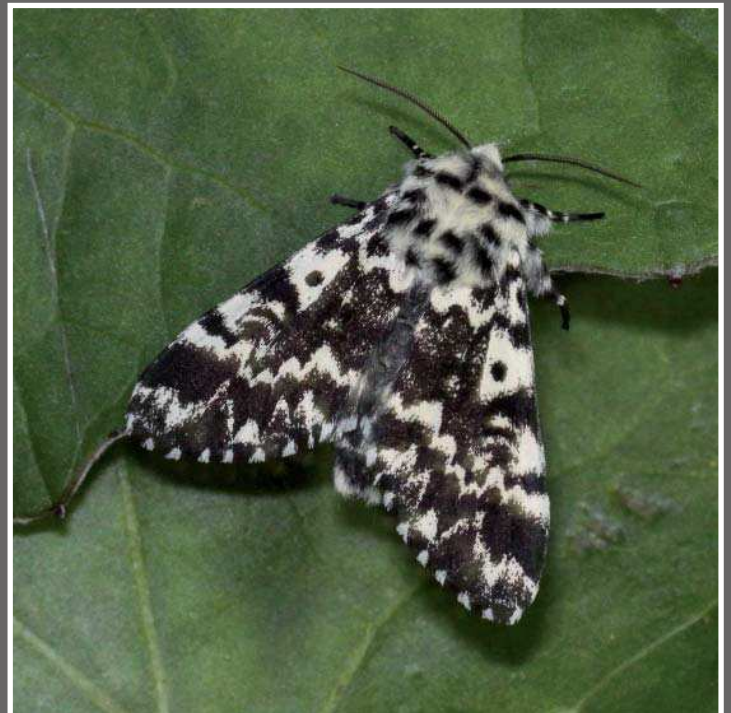
Actinotia radiosa (Esper, [1804]).