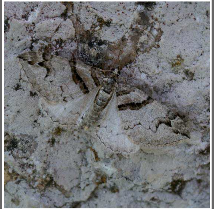
Olethreutes arcuella (Clerck, 1759).