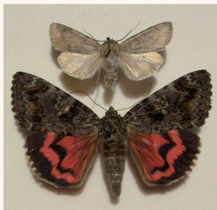
Euxoa culminicola Stgr et Catocala sponsa L., deux des espèces observées à Val-Thorens.

Mais André ne peut accepter cette concurrence inopinée