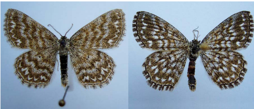
De gauche à droite : Scopula immorata , S. tessellaria habitus typique.

Qu'en conclure ? La bête était là et s'est finalement montrée, ce qui ne paraît pas illogique puisqu'elle est connue des départements de l'Yonne et du Loiret tout proches ?