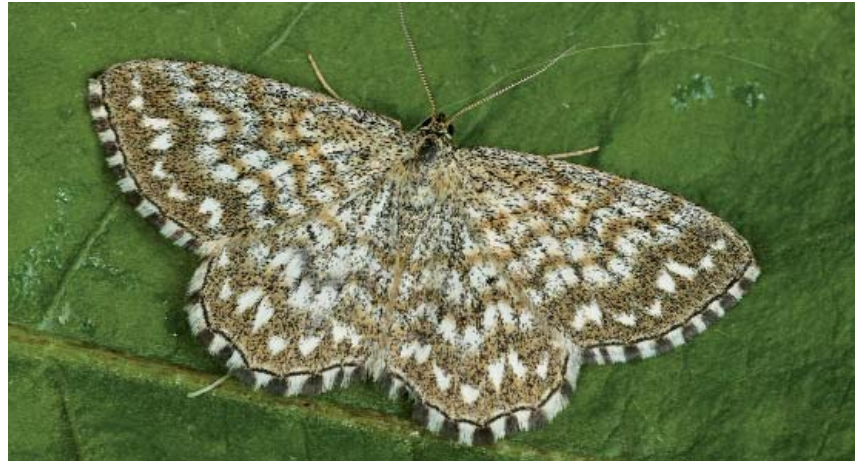
Scopula tessellaria . Arcey (Côte d'Or), 2-VI-2007. Photo D. MOREL.

Mots-clés : Lepidoptera, Geometridae, Scopula tessellaria , géométrie, France.