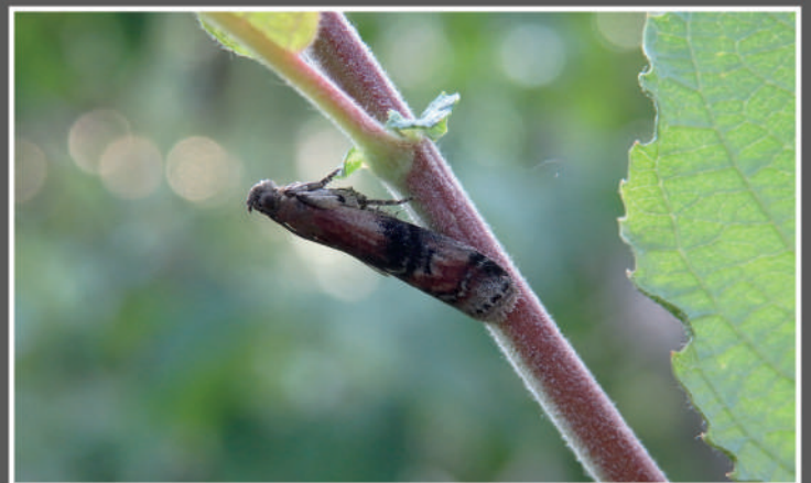
Ectropis crepuscularia (Denis & Schiff., 1775), 21-IX-2014, Forêt de la Péliissonnière (Vendée).