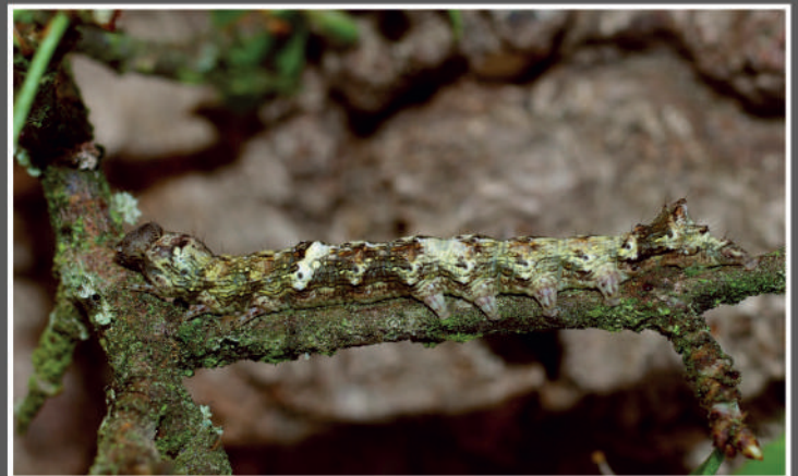
Yponomeuta mahalebella (Guenée, 1845), hibernaculum, 28-XI-2011, Montreuil-sous-Bois (Seine-Saint-Denis). © MARIE-ANDRÉ LANTZ. Cleorodes lichenaria (Hufnagel, 1767), 4-XI-2017, La Dominelais (Ille-et-Vilaine). © JEAN-PIERRE FAVRETTO. Anarta myrtilli (Linnaeus, 1760), 27-VII-2010, Fougeré (Vendée). © JEAN-PIERRE FAVRETTO. Tephronia sepiaria (Hufnagel, 1767), 10-IV-2018, Rézé (Loire-Atlantique). © JEAN-PIERRE FAVRETTO.