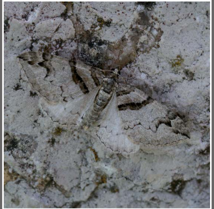
Olethreutes arcuella (Clerck, 1759).