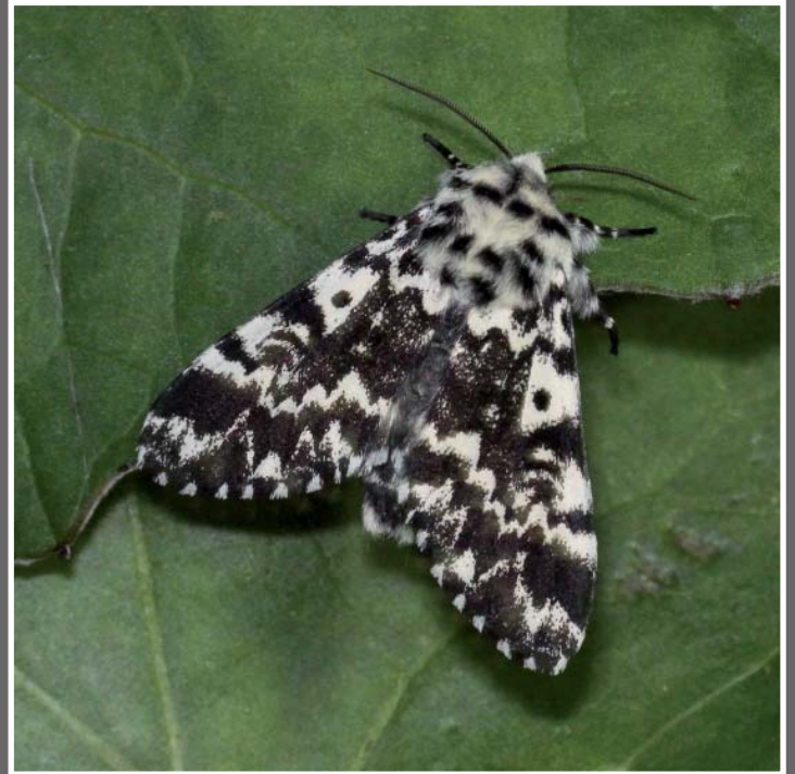
Actinotia radiosa (Esper, [1804]).