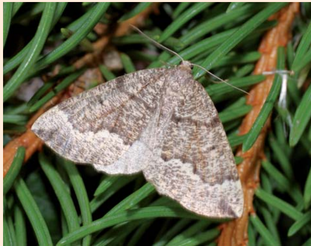
Pungeleria capreolaria .

Le 27 septembre 2013, lors d'une prospection en commun avec l'ONF et l'Association des entomologistes de Picardie (ADEP), Hervé PENAUD capture ce papillon dans l'Oïse, en forêt de Compiègne, carrefour Molleveaux, alt. 67,5 m). Ce nouveau département picard est à ajouter à la répartition de ce géomètre.