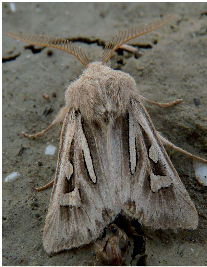
Cladocerotis optabilis Bsdv., 11-X-2008, Arles-La Tour du Valat (13), © O. PINEAU.