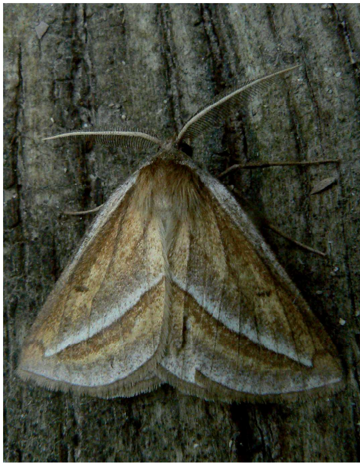
Chariaspilates formosaria Evers., 22-V-2008, Arles-La Tour du Valat (13).