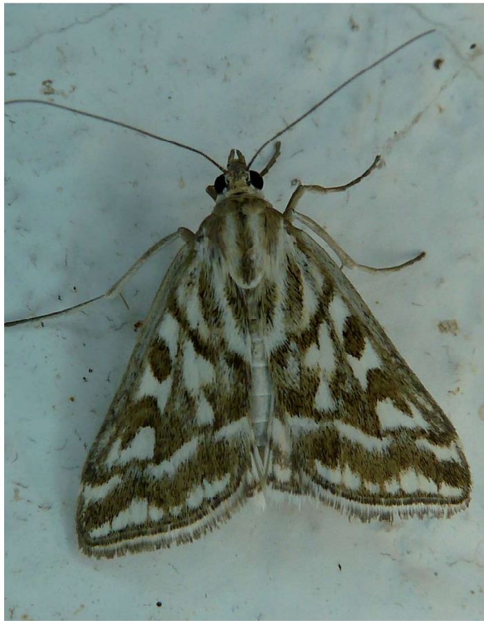
Loxostege comptalis Frr, 15-VI-2011, Arles-La Tour du Valat (13).