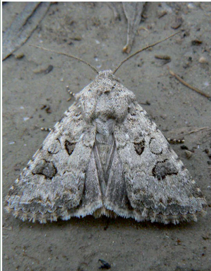
Hadula sodae Bsdv., 26-IV-2009, Arles-La Tour du Valat (13).