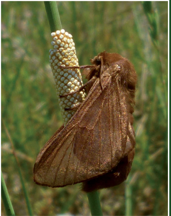
Malacosoma franconica D. & S. : femelle et sa ponte, 24-VI-2010, Arles (13).