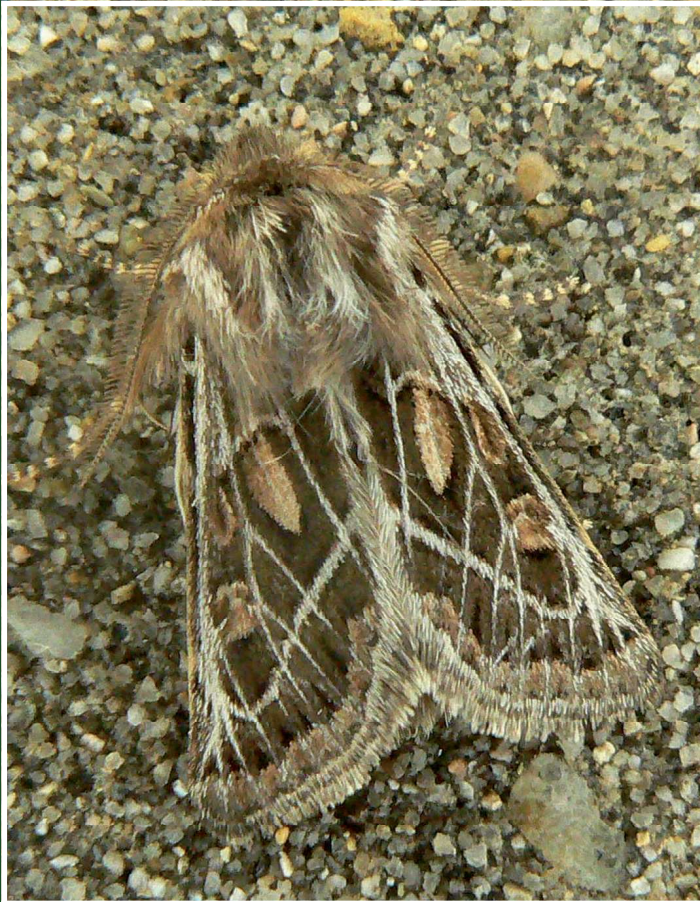
Ulochlaena hirta Hb., 22-X-2009, Arles-La Tour du Valat (13).