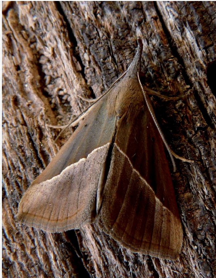
Hypena lividalis Hb., 4-X-2008, Arles-La Tour du Valat (13), © O. PINEAU.