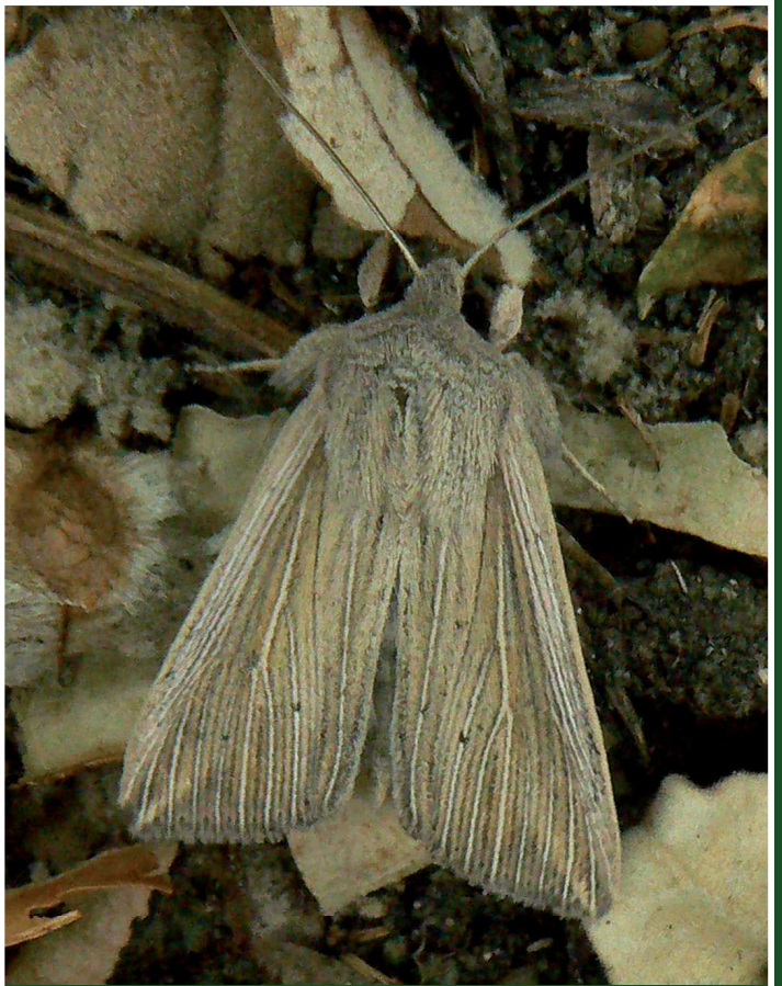
Mythimna riparia Bsdv., 24-V-2010, Arles-La Tour du Valat (13).