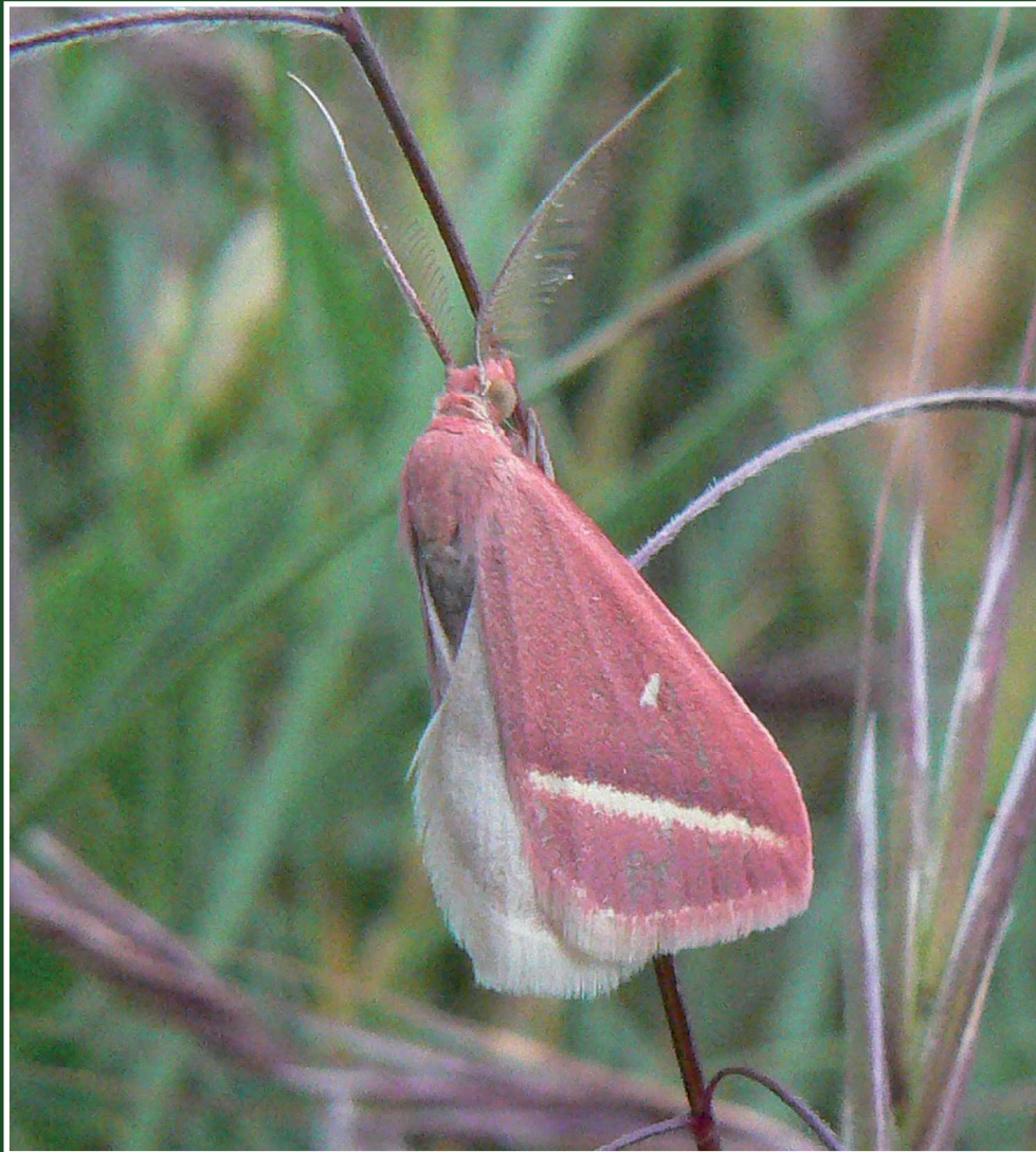
Casilda consecraria Stgr, 15-V-200, Arles-La Tour du Valat (Bouches-du-Rhône).

La faune des lépidoptères de Camargue est estimée à environ 1000 espèces. Les réserves qui ont accueilli les rencontres d' oreina sont fortement marquées par l'influence maritime et leurs milieux salins permettant à toute une faune halophile de prospérer. Revers de la médaille, les espèces de ripisylve d'eau douce sont largement absentes. Il en résulte un nombre relativement modeste d'espèces, avec en contrepartie une spécialisation très forte. Le tout est tempéré par une situation géographique idéale pour observer les migrants saisonniers qui traversent la Méditerranée et ajoutent un cachet original à la diversité constatée. Les photos d'Olivier Pineau, qui nous a accueillis sur place et qui suit attentivement l'évolution de l'entomofaune des réserves, reflètent ces particularités.