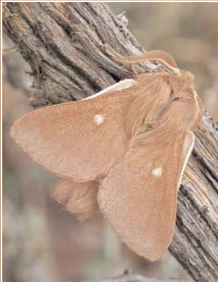
Eriogaster rimicola D. & S. ♂.