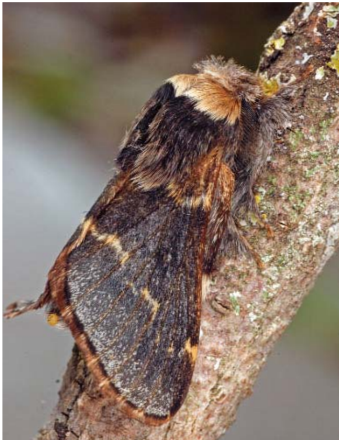
Poecilocampa populi L. ♂.