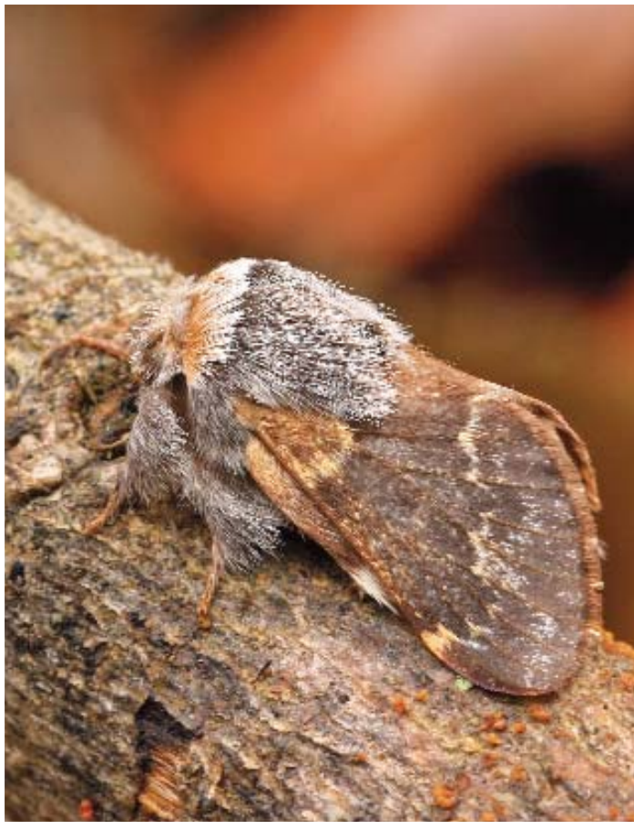
Poecilocampa coluchei Varenne & Billi ♂.