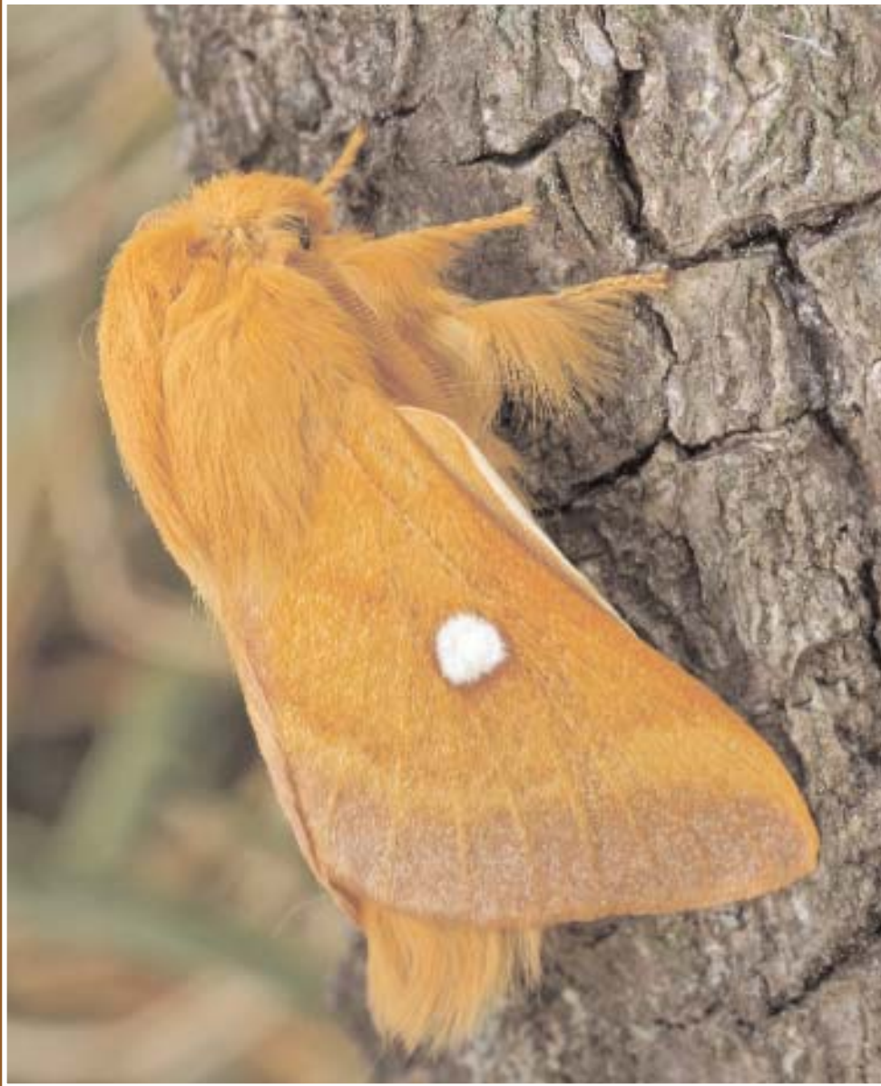
Eriogaster catax L. ♂.

Sur le mode “thème et variations”, voici ce qu’il est convenu d’appeler les “bombyx”, caractérisés par une allure robuste, une livrée d’une ornementation sobre et “chic”. Des espèces crépusculaires ou nocturnes, mais aussi diurnes comme certaines du genre Malacosoma notamment. Le dimorphisme sexuel est assez prononcé, voire très accentué. Les chenilles vivent surtout sur les feuillus, des arbustes et arbres fruitiers, le mélèze pour Poecilocampa canensis ; celles d’ Eriogaster arbusculae se nourrissent sur les arbres nains de haute altitude ( Salix , Alnus , Betula ...) puis, aux derniers stades, de plantes basses.