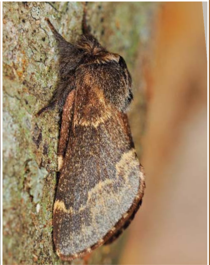
P. canensis Mill. ♀.