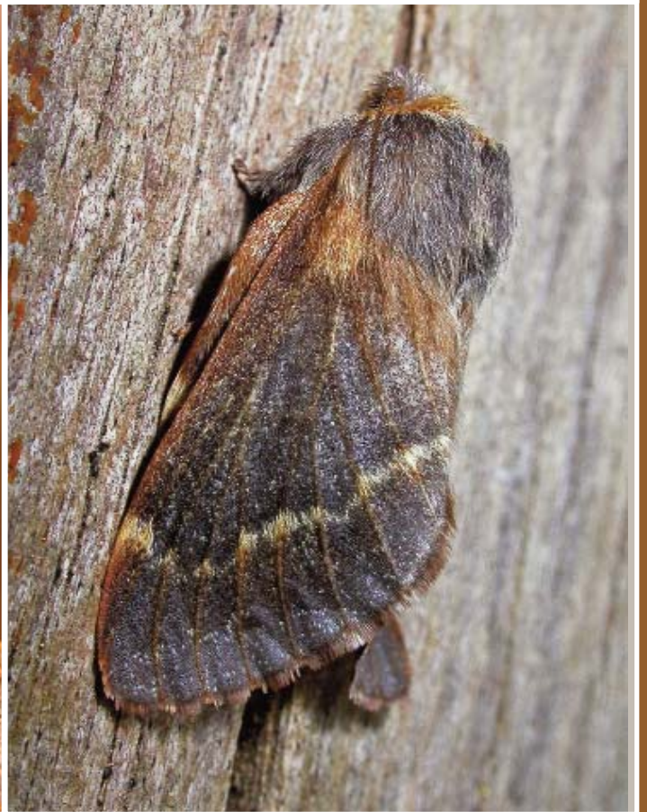
P. coluchei Varenne & Billi ♀.