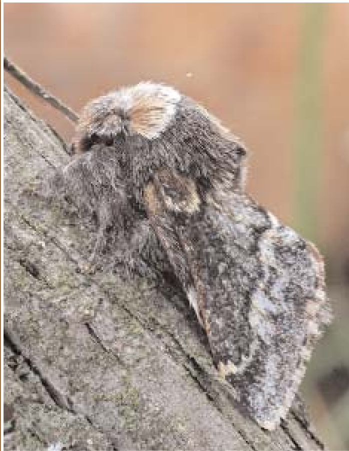
Poecilocampa canensis Mill. ♂.