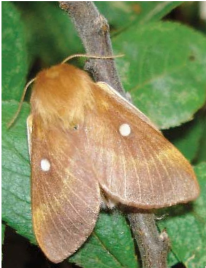
Eriogaster catax L. ♀.