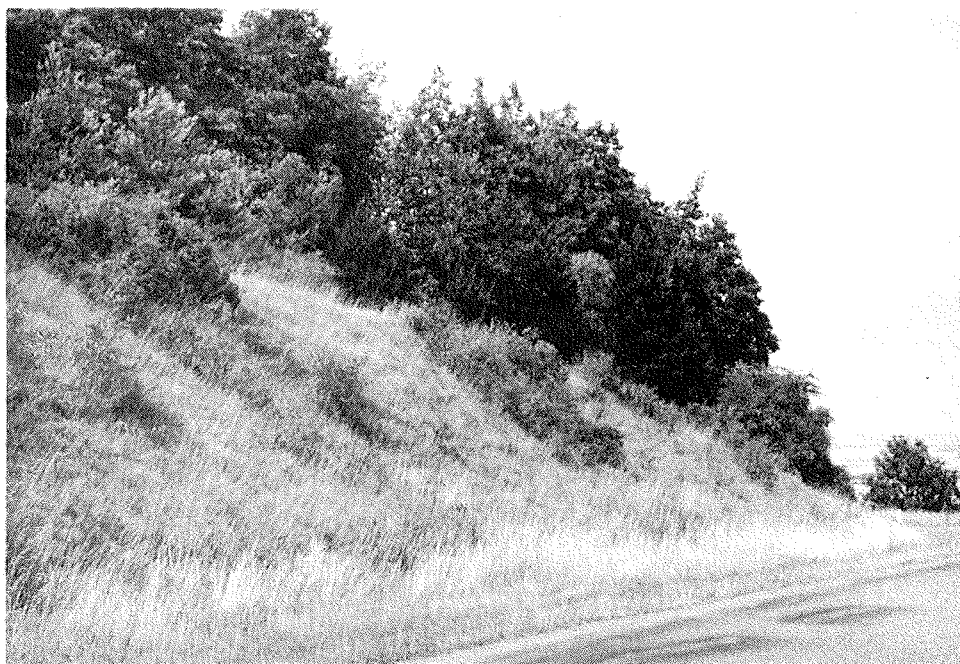
Fig. 1. - Talus sur pente calcaire de la côte de Bouilly, au lieu dit les Essarts, en juillet 1985.