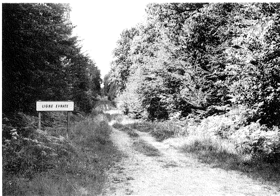
Fig. 2. - La ligne Évrata, dans la forêt syndicale de Jeugny (ONF), en juillet 1985.