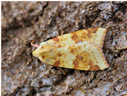
Xanthia icteritia .

lum, 6 mâles et 3 femelles le 14-IX-1987 lum. et 1 ex. le 15-IX-1987 lum. à Payzac (Ardèche). • 4764 Polyphaenis sericata (Esper, 1787). (4379 ; 697). 1 ex. le 30-VII-1980 miellée à Payzac (Ardèche). • 4767 Dypterygia scabriuscula (Linnaeus, 1758). (4376 ; 642). 1 ex. le 10-VII-1975 miellée, 2 ex. le 16-VII-1975 miellée, 1 ex. le 2-VII-1979 miellée, 1 ex. le 24-VII-1980 miellée, 1 ex. le 25-VII-1982 miellée, 1 ex. le 17-VIII-1989 miellée et 2 ex. le 20-VIII-1989 miellée à Payzac (Ardèche). • 4768 Mormo maura (Linnaeus, 1758). (4375 ; 641). 1 femelle le 10-IX-1976 lum. à Mathay (Doubs). 1 ex. le 15-VIII-1975 lum. à Les Vans (Ardèche), 1 ex. le 12-VII-1978 lum. à Malarce (Ardèche), 1 ex. le 12-VII-1979 à La Jasse (Gard) et 1 ex. le 25-VII-1980 lum. à Payzac (Ardèche). • 4472 Xanthia icteritia (Hufnagel, 1766). (4327 ; 626). 1 ex. le 06-IX-1975 lum. à Mathay (Doubs).