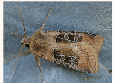
Chersotis cuprea .