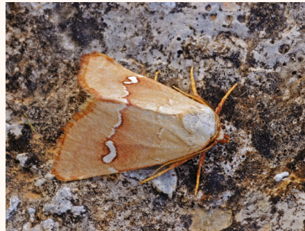
Haemerosia renalis . © D. MOREL.