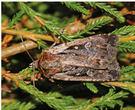
Xestia agathina .