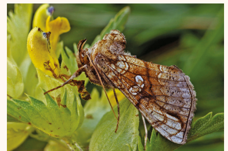
Polychrysis moneta .