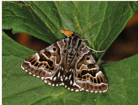
Callistege mi .

Comme dans la précédente publication (décembre 2015), le numéro précédant le nom de chaque espèce est celui de la Liste systématique et synonymique des lépidoptères de France, Belgique et Corse (Leraut, 1997). Les numéros qui suivent le nom de chaque espèce et mis entre parenthèses sont ceux de la première Liste Leraut (1980) puis du numéro du catalogue des Lépidoptères de France et de Belgique de Léon Lhomme (1923).