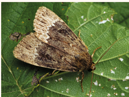
Amphipyra perflua .

13-IX-1988 miellée et 1 mâle le 24-VIII-1989 miellée à Payzac (Ardèche).