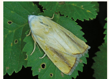
Pardoxia graellsii .