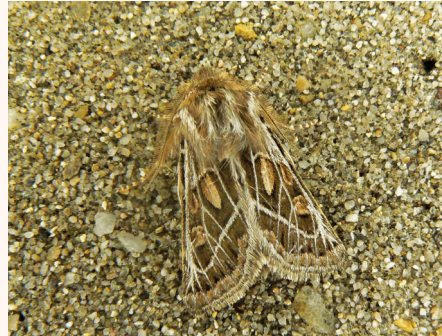
Ulochlana hirta .

• 4479 Omphaloscelis lunosa (Haworth, 1809). (4319 ; 608). 1 ex. le 6-VIII-1976 lum. et 1 ex. le 15-VIII-1976 lum. à L'Estréchure (Gard). 1 ex. e.p. le 29-VII-1978 et 1 ex. le 20-VII-1986 miellée à Payzac (Ardèche). • 4504 Eupsilia transversa (Hufnagel, 1766). (4293 ; 595). 1 ex. le 10-III-1977 à Audincourt (Doubs). • 4505 Eumichtis lichenea (Hübner, 1813). (4292 ; 570). 1 ex. le 27-X-1987 à Amélie-les-Bains (Pyrénées-Orientales), leg. Tavoillot. • 4543 Xylena vetusta (Hübner, 1813). (4253 ; 559). 1 ex. le 19-XI-1974 à Beaulieu (Doubs). 1 ex. le 14-V-1975 à Mathay (Doubs). • 4555 Aporophila nigra (Haworth, 1809). (4240 ; 547). 1 mâle et femelle le 27-X-1987 à Amélie-les-Bains (Pyrénées-Orientales), leg. Tavoillot. • 4569 Ulochlana hirta (Hübner, 1813). (4230 ; 539). 1 mâle le 17-IX-1987 lum. à Payzac (Ardèche). • 4579 Brachylomia viminalis (Fabricius, 1776). (4223 ; 542). 1 ex. le 9-VIII-1993 lum. à Mailhac (1100 m) (Haute-Loire). 1 ex. le 17-VIII-1993 à Rieutord (Ardèche). • 4739 Cosmia pyralina (Denis & Schiffmüller, 1775). (4400 ; 758). 1 ex. le 9-VII-1975 lum. à Mathay (Doubs).