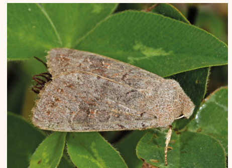
Orthosia populeti .

le 14-VI-1975 lum. à Mathay (Doubs). • 4788 Aletia impura (Hübner, 1808). (4166 ; 493). 1 ex. le 17-VIII-1993 lum. à Rieutord (Ardèche). • 4791 Aletia vitellina (Hübner, 1808). (4162 ; 472). 2 ex. le 11-VIII-1975 miellée et 1 ex. le 24-VIII-1990 miellée à Payzac (Ardèche). • 4792 Aletia albipuncta (Denis & Schiffmüller, 1775). (4161 ; 471). 1 femelle le 5-VI-1975 lum. et 1 femelle le 11-IX-1976 lum. à Mathay (Doubs). 2 ex. le 9-IX-1988 lum. à Saugnac-et-Cambran (Landes). • 4793a Aletia ferrago argyritis (Rambur, 1858). (4160a ; 470). 4 ex. le 10-VIII-1975 miellée, 1 ex. le 11-VIII-1975 miellée, 2 ex. le 20-VII-1976 miellée, 1 ex. le 19-VIII-1989 miellée, et 1 ex. le 26-VIII-1989 miellée à Payzac (Ardèche). • 4794 Aletia conigera (Denis & Schiffmüller, 1775). (4159 ; 455). 1 ex. le 31-VIII-1981 lum. à Payzac (Ardèche). 1 ex. le 15-VIII-1989 lum. à Rieutord (Ardèche). • 4798 Orthosia gothica (Linnaeus, 1758). (4155 ; 461). 1 ex. le 6-IV-1975 lum. et 1 ex. le 14-IV-1975 lum. à Mathay (Doubs). • 4799 Anorthoa munda (Denis & Schiffmüller, 1775). (4154 ; 462). 4 ex. le 14-IV-1975 lum. à Mathay (Doubs). • 4800 Orthosia incerta (Hufnagel, 1766). (4153 ; 467). 2 ex. le 25-IV-1975 lum., 3 ex. le 28-IV-1975 lum. et 1 ex. le 14-V-1975 lum. à Mathay (Doubs). • 4801 Orthosia cerasi (Fabricius, 1775). (4152 ; 465). 1 mâle et 1 femelle le 14-IV-1975 lum. à Mathay (Doubs). • 4803 Orthosia populeti (Fabricius, 1775). (4150 ; 463). 2 mâles 19-IV-1975 lum. à Mathay (Doubs).