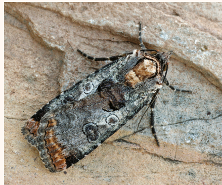
Epilecta linogrisea .