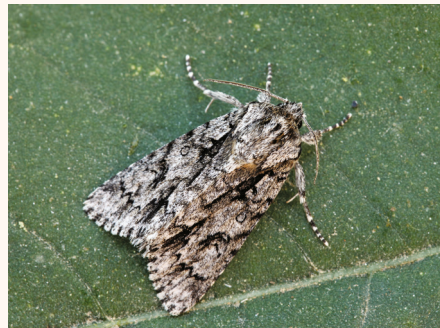
Viminia auricoma .