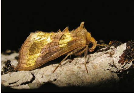
Diachrysis chrysitis .