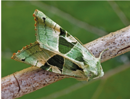
Phlogophora scita .

lum, 6 mâles et 3 femelles le 14-IX-1987 lum. et 1 ex. le 15-IX-1987 lum. à Payzac (Ardèche). • 4764 Polyphaenis sericata (Esper, 1787). (4379 ; 697). 1 ex. le 30-VII-1980 miellée à Payzac (Ardèche). • 4767 Dypterygia scabriuscula (Linnaeus, 1758). (4376 ; 642). 1 ex. le 10-VII-1975 miellée, 2 ex. le 16-VII-1975 miellée, 1 ex. le 2-VII-1979 miellée, 1 ex. le 24-VII-1980 miellée, 1 ex. le 25-VII-1982 miellée, 1 ex. le 17-VIII-1989 miellée et 2 ex. le 20-VIII-1989 miellée à Payzac (Ardèche). • 4768 Mormo maura (Linnaeus, 1758). (4375 ; 641). 1 femelle le 10-IX-1976 lum. à Mathay (Doubs). 1 ex. le 15-VIII-1975 lum. à Les Vans (Ardèche), 1 ex. le 12-VII-1978 lum. à Malarce (Ardèche), 1 ex. le 12-VII-1979 à La Jasse (Gard) et 1 ex. le 25-VII-1980 lum. à Payzac (Ardèche). • 4472 Xanthia icteritia (Hufnagel, 1766). (4327 ; 626). 1 ex. le 06-IX-1975 lum. à Mathay (Doubs).