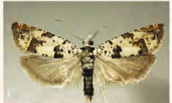
Fig. 2 : Eucosma diakonoffi , Col du Noyer, 19-VI-2017.

BALDIZZONE (G.), CABELLA (C.), FIORI (F.) & VARALDA (P.G.), 2013. – I lepidotteri del parco naturale delle capanne di marcarolo (Italia, Piemonte, appennino ligure-piemontese). Memorie dell'associazione naturalistica piemontese , vol. Xii : 349 p.