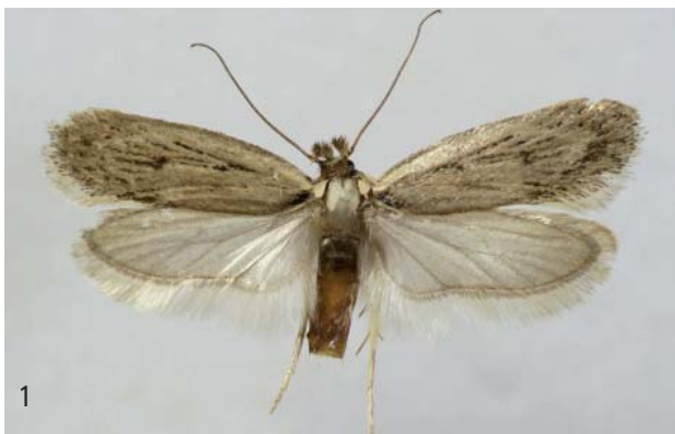
Fig. 1. Depressaria zelleri Staudinger, 1879, mâle. Aven de la Vache, Pompignan, Gard, 10-VII-2009, J.-Ch. & D. Grange leg.

Elle pourra être placée près de D. pimpinellae Zeller, 1839 (n° 1138) dans la liste Leraut (1997). ■