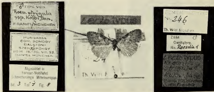
Abb. 3. Designerter Lectotypus von Roeselia strigula kolbi DANIEL, 1935 mit Etikettierung.

Auch in diesem Fall ist es gemäß Artikel 74 der Internationalen Regeln für die Zoologische Nomenklatur (KRAUS 1970) erforderlich, einen Lectotypus festzulegen, da in der Originalbeschreibung kein Holotypus erwähnt ist und auch am Material kein Exemplar eindeutig als solcher bezettelt ist. Die Verfasser wählen das bei FORSTER & WOHLFAHRT (1960) abgebildete Exemplar aus, bestimmen es zum Lectotypus (Designation) (Abb. 3) und versehen es mit einer zusätzlichen roten Etikette "Lectotypus, Roeselia strigula kolbi DANIEL ♂, Thomas WITT & J. DE FREINA, München". Gemäß Empfehlung 74E der Nomenklaturregeln werden die verbleibenden Exemplare als Paralectotypen etikettiert.