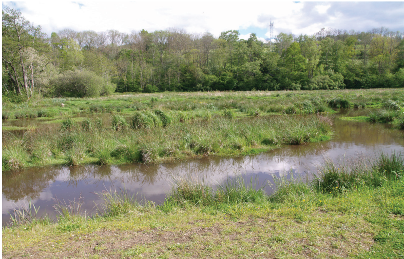
Zone humide du lac d'Aydat (Puy-de-Dôme).

www.lepinet.fr consulté en novembre 2016.