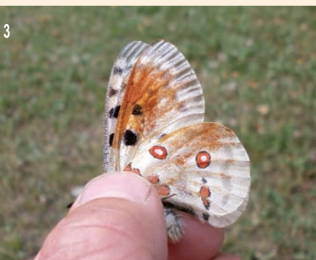
Fig. 1, Lis orangé ( Lilium bulbiferum ), Châteauroux-les-Alpes, 1600 m, 7-VII-2013 ; fig. 2, Aporia crataegi L., Sainte-Anastasia (Cantal), 23-VII-2013 ; fig. 3, Parnassius apollo L., Châteauroux-les-Alpes, vallée du Rabioux, 1500 m, 7-VII-2013.

25, rue de la Treille F-63000 Clermont-Ferrand fournier63@sfr.fr