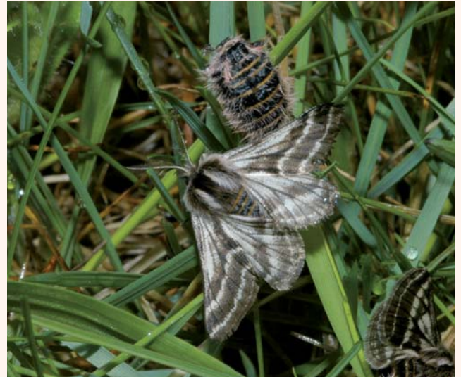
Lycia zonaria

SPILL (FR.), 2011. – 15 années d'observations de Lycia