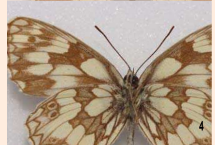
1 et 2. Melanargia galathea f. lugens . 3 et 4. M. galathea f. grisescens .