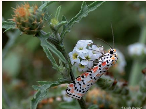
Utheteisa pulchella .

2011 est décidément un bon millésime pour Utheteisa pulchella . L'excellente photo ci-jointe nous montre un exemplaire observé par Jean-Louis Régnier (Sainte-Savine, Aube), le 12 septembre 2011 vers 16 h 30 au début de la Conche des Baleines, lieu-dit le Pas de la Chau-me, à Saint-Clément-des-Baleines, île de Ré (Charente-Maritime, UTM 30TXS12). Merci pour ce signalement via Jean-Pierre Lacour. ■