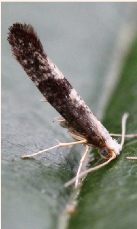
Argyresthia glaucinella en position de repos, Plougrescant (Côtes-d'Armor).

Cette espèce est nouvelle pour la région Bretagne et ne semble pas commune en France ni dans les pays limitrophes. Localisée aux sous-bois et allées forestières (Chênes, Bouleaux et Marronniers), elle a sans doute été confondue avec Argyresthia spinosella Stainton, 1849 qui elle vole près des Prunelliers.