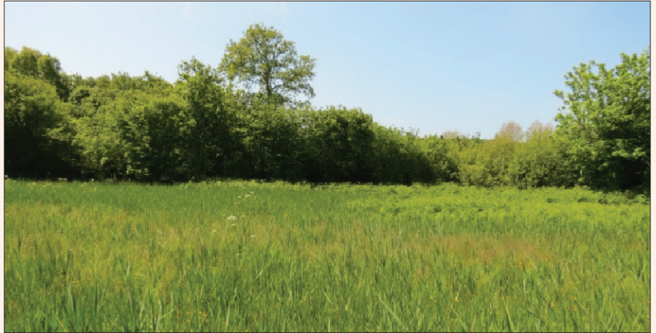
Marais de Guermel (UTM : VV80).

C'est en battant les branches d'un Chêne en périphérie du marais et situé sur la commune de Plougrescant (VV80) que nous avons trouvé Argyresthia glaucinella .