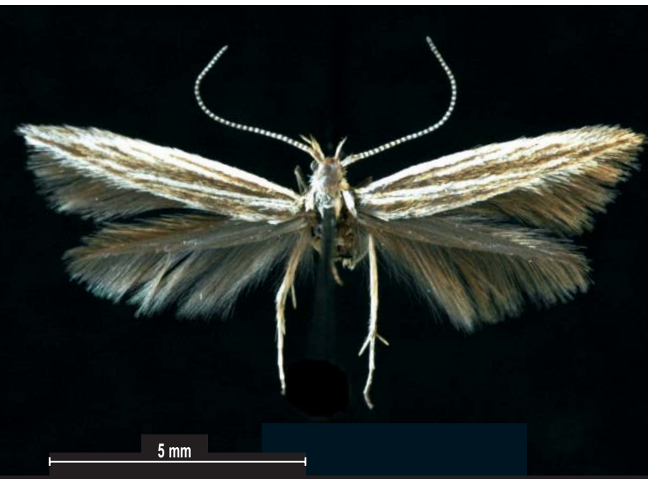
Coleophora pappiferella femelle.

Mots clés. Lepidoptera, Coleophoridae, Coleophora pappiferella Hofmann, 1869, faune de France, espèce nouvelle.