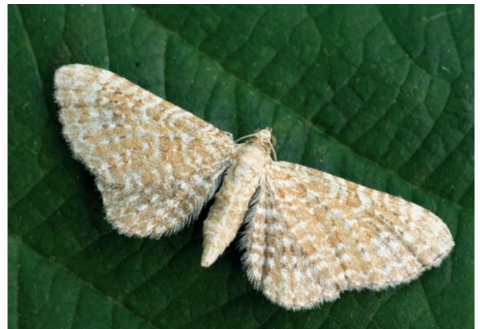
Eupithecia spissilineata Metzner.

Nous la pensons crépusculaire, car les quatre imagos arrivèrent dans la dernière demi-heure de la tombée du jour.