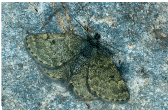
Glacies noricana belzebuth Praviel.

Glacies noricana belzebuth Praviel, 1938. Deux exemplaires capturés le 28 juillet 2007 et déterminés grâce aux genitalia, nous firent retourner dans les Alpes-de-Haute-Provence sur la commune de Jausiers le 4 août 2009, ce qui nous permit d'en croiser un troisième exemplaire. Il vole de concert avec Glacies canaliculata au col de Restefond.