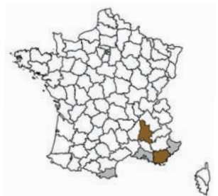
Idaea exilaria Gn.

C'est un unique mâle le 27 juin 2009 qui arriva à notre source lumineuse dans le département du Var, sur la commune des Adrets-de-l'Estérel. Une recherche de jour dans le même biotope le 17 juillet 2009 nous permit la capture d'une femelle au filet.