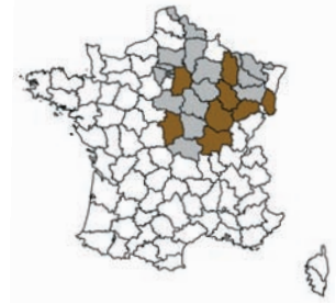
Euphydryas maturna L.

Euphydryas maturna (Linnaeus, 1758). C'est toujours un grand moment d'émotion de voir voler cette belle espèce parmi les Limenitis populi et la multitude de Lopinga achine . Le Damier du frêne reste relativement bien représenté en Côte-d'Or sur la commune de Moloy, les forêts froides environnantes regorgeant de frêne. Une trentaine d'exemplaires furent comptabilisés les 5 et 13 juin 2009.