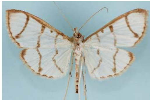
Fig. 1. Zebronia phenice (Stoll, 1782), Vallon de Stêr-Vraz, Sauzon, Morbihan, France, 15.VIII.1982. BRUNO LAMBERT leg.

Résumé. – Zebronia phenice (Stoll, 1782) a été découverte par l'auteur en 1982 dans le Morbihan. Il s'agit d'une nouvelle espèce de pyrale pour la faune de France.